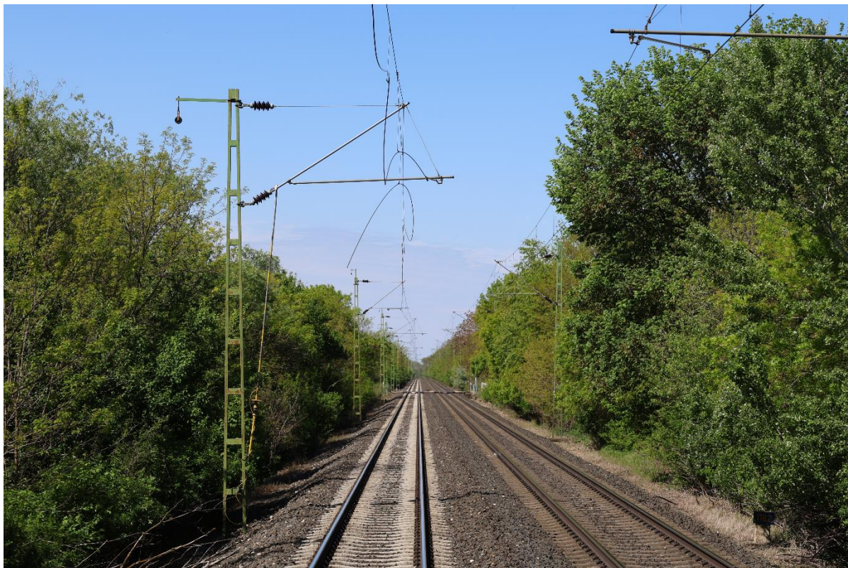
3. kép: Műszaki nehézmény (anyagfáradás miatti felsővezetékszakadás) Nagyszentjános és Ács állomások között 2026.04.29.

Áprilisban 29 esetben történt forgalmi vagy műszaki nehézmény.