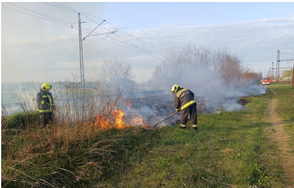
4. kép: Avartűz Tuzsér és Záhony állomások között 2026.04.14.

A tárgyhónapban 5 történt; 3 vasúti infrastruktúrát érintő avartűz (Almásfüzitő és Komárom, Tuzsér és Záhony, valamint Jászfényszaru és Pusztamonostor állomások között), illetve 2 esetben talpfák gyulladtak meg (Kőbánya felső és Tab állomásokon).