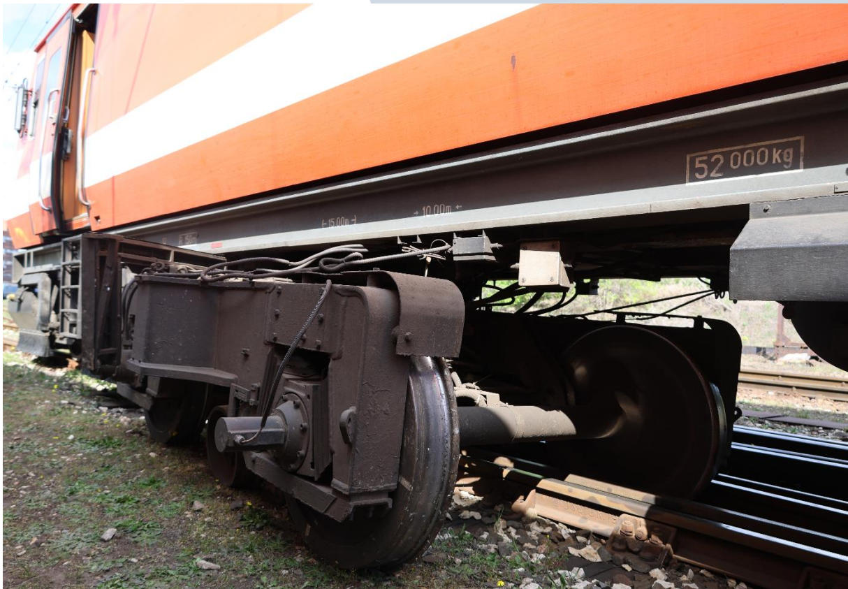
1. kép: Tolatás közben bekövetkezett baleset Ferencváros VJBI telephelyen, 2026.04.17.

Az események 11 esetben a MÁV Pályaműködtetési Zrt., 5 esetben a MÁV Személyszállítási Zrt., 1 esetben a MÁV Rail Tours Kft. munkavállalóinak mulasztása miatt történtek.