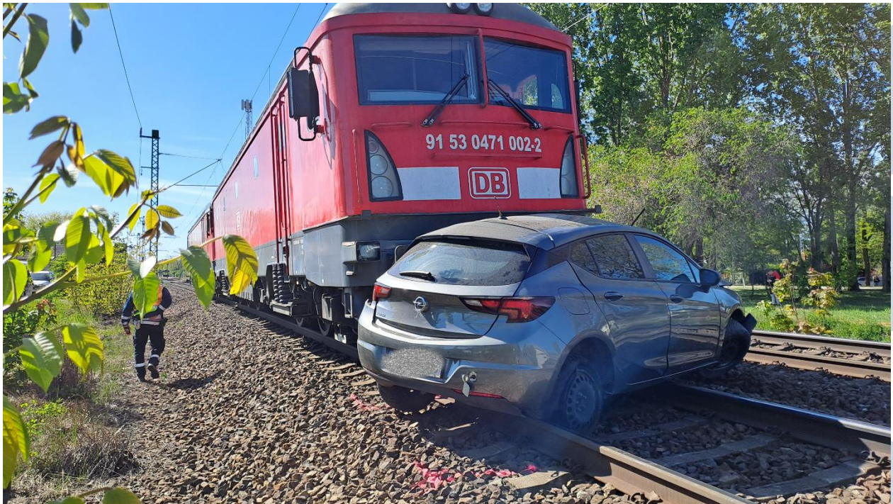
2. kép: Vasúti útátjáróban bekövetkezett baleset Üllő állomás SR3 jelű sorompójában, 2026.04.30.

Mindhárom esetben a gépjármű (személygépkocsi) vezetője szegte meg a KRESZ előírásait (két fényoszlopával és egy fény- és félsorompóval biztosított vasúti átjáróban). Személyi sérülés nem történt, a balesetek anyagi kárral jártak és jelentős vonatkéséseket okoztak.