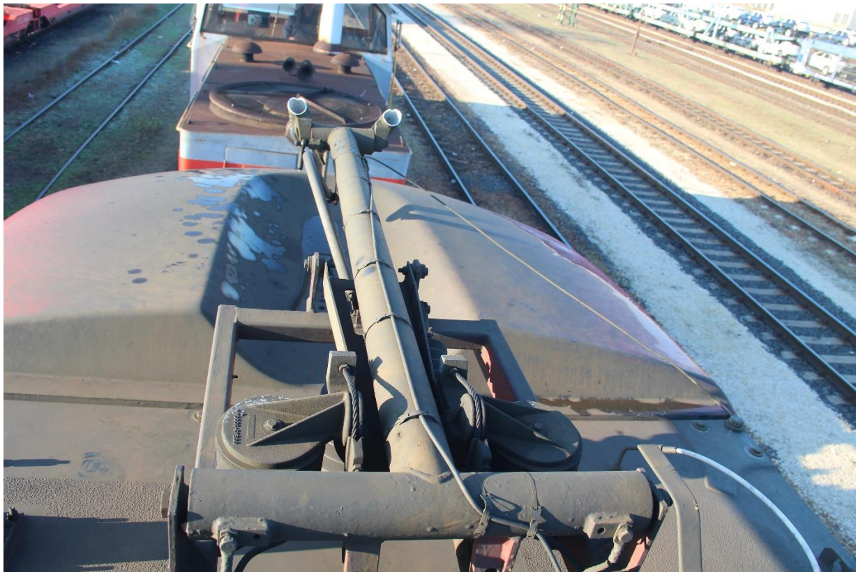
2. kép: Hegyeshalom állomáson az úrszelvénybe lógó felsővezetési elem okozta áramszedősérülés, 2024.12.27.