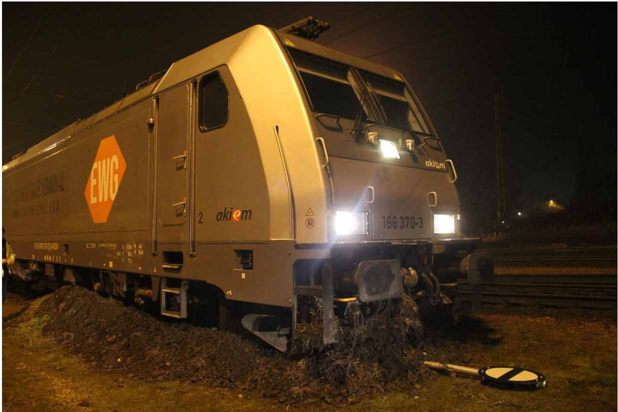
1. kép: Elegyrendezés (síktolatás) közben bekövetkezett baleset Cegléd állomáson, 2024.12.07.