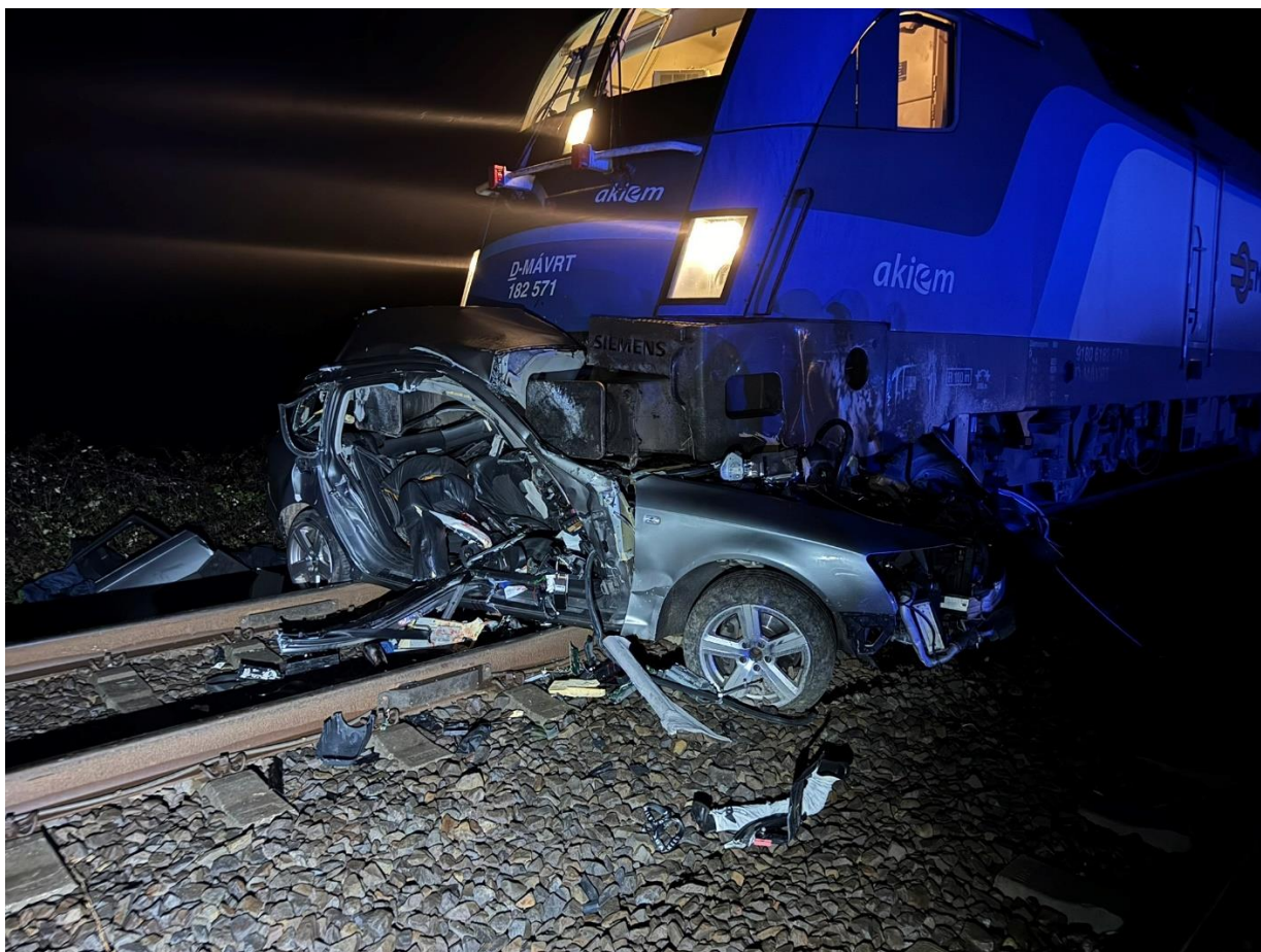
3. kép: Vasúti átjáróban bekövetkezett baleset Karcag és Püspökladány állomások között, 2024.12.29.