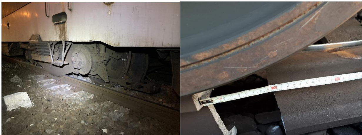
1. kép: Közlekedő vonat balesete (kisiklás) Budapest-Keleti pályaudvaron 2024.10.21.