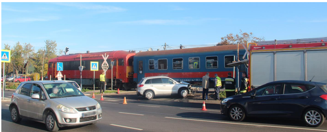
2. kép: Vasúti átjáróban bekövetkezett baleset Kispest és Pestszentimre állomások között 2024.10.29.