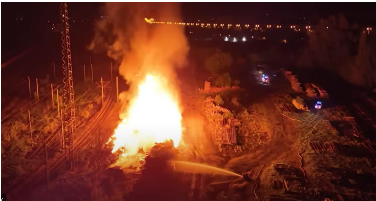
3. kép: Egyéb tűz Rákosrendező állomáson 2024.10.30.