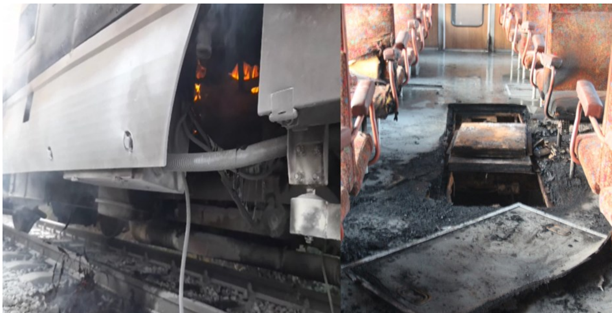
1. kép: Közlekedő vonat vasúti járművében keletkezett tűz Nagyigmánd-Bábolna és Komárom állomások között 2024.09.10.