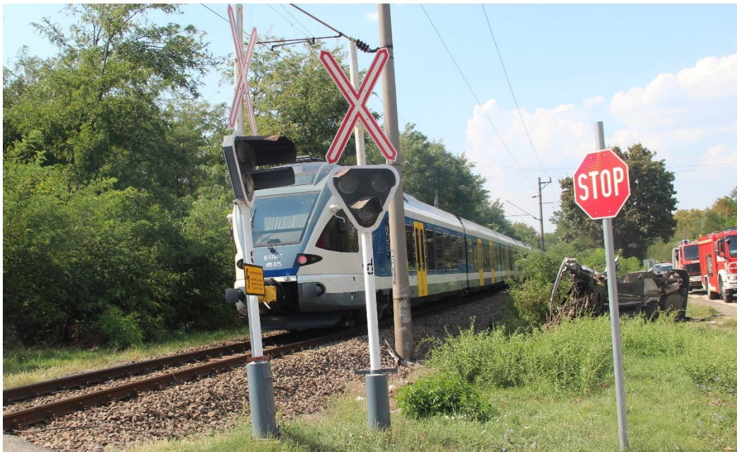
4. kép: Vasúti átjáróban bekövetkezett baleset Vácrátót és Vác állomások között 2024.09.04.