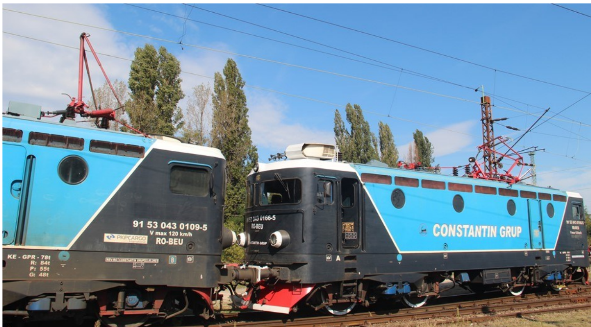
2. kép: Rongálódásos vasúti baleset Rákosrendező állomáson 2024.09.20.