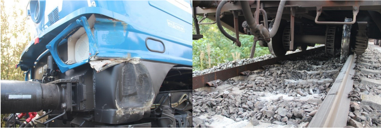
3. kép: Vonat ütközése úrszelvényben lévő akadállyal Soroksári út és Soroksár állomások között a 63. szelvényben 2024.09.24. (A 41137-2 sz. vonat egy úrszelvénybe befordult munkagéppel ütközött. A mozdony és az első 7 db kocsit kisiklott, a kisiklott járművek és a pálya kb. 160 m hosszban megrongálódtak).