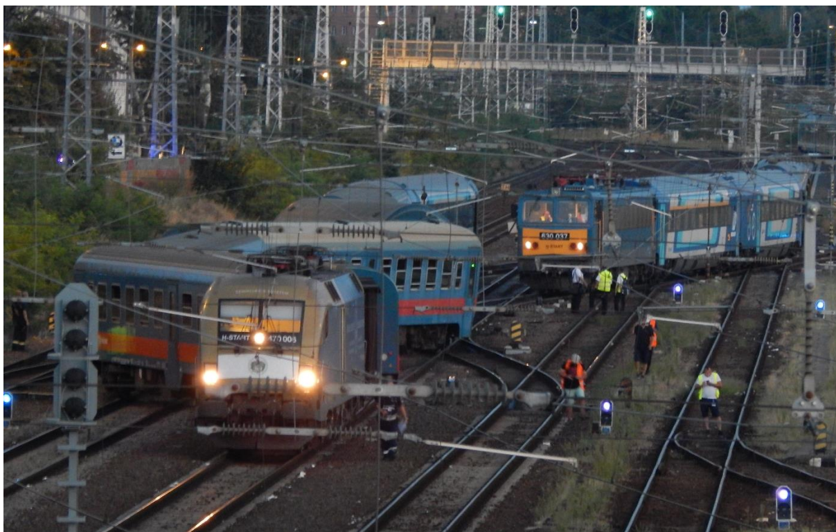
1. kép: Közlekedő vonat balesete (kisiklás) Budapest-Keleti pályaudvaron, 2024.08.25.