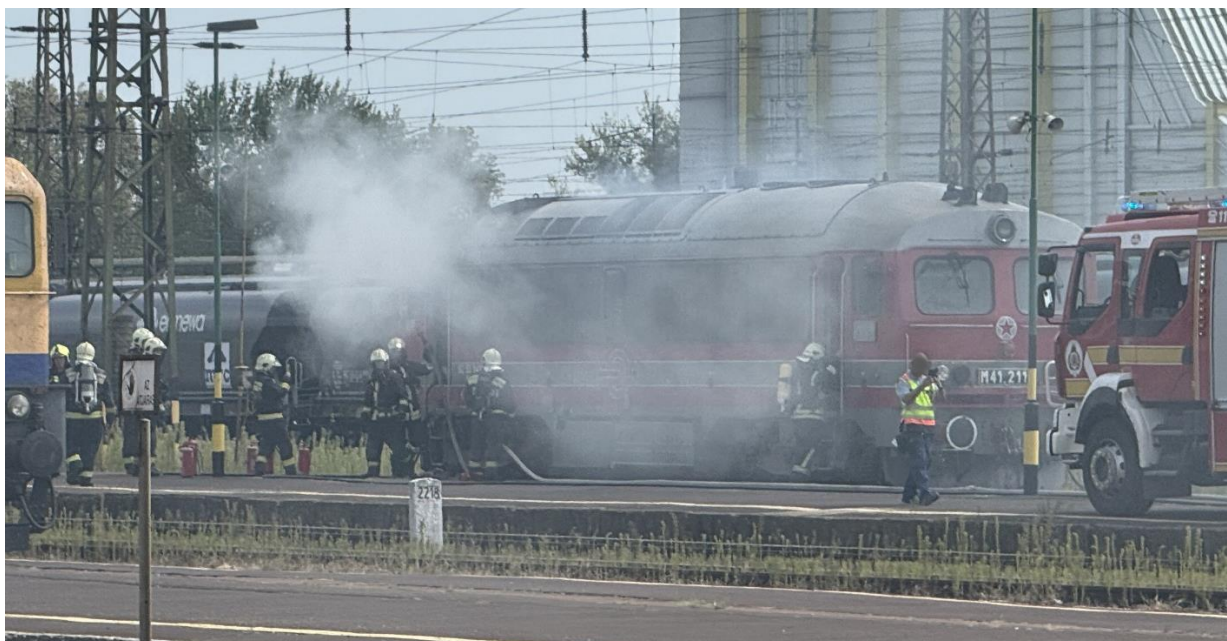
2. kép: Közlekedő vonat vasúti járművében keletkezett tűz Debrecen állomáson 2024.08.15.