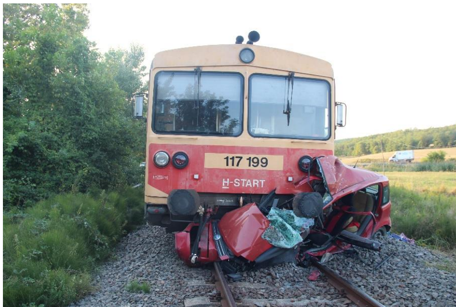
3. kép: Vasúti utátjáróban bekövetkezett baleset Hidas-Bonyhád és Bátaszék állomások között 2024.08.13.