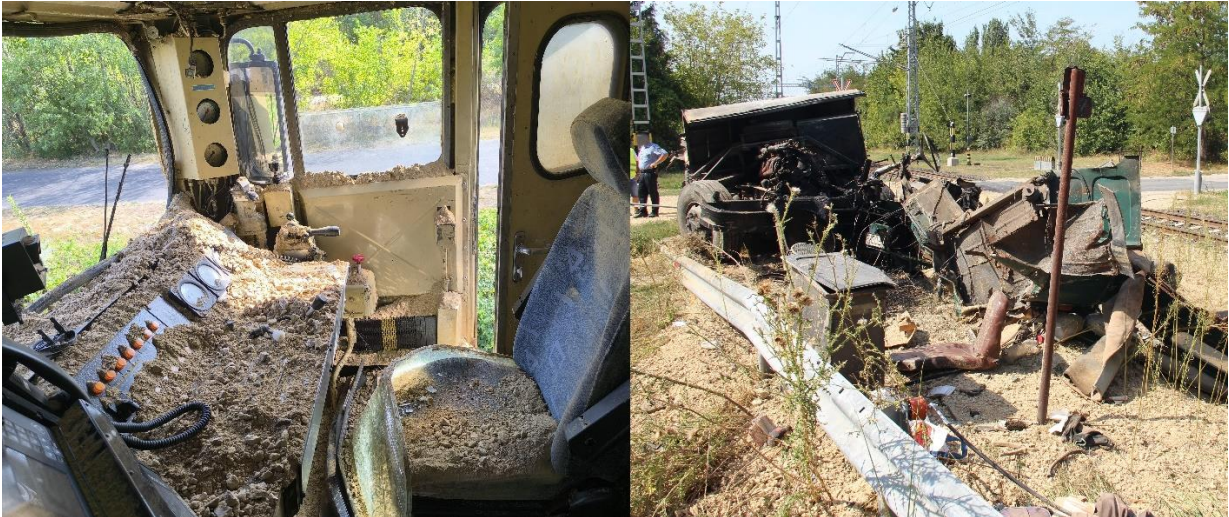
4. kép: Vasúti útátjáróban bekövetkezett baleset Polgárdi-Ipartelepek állomáson 2024.08.26.