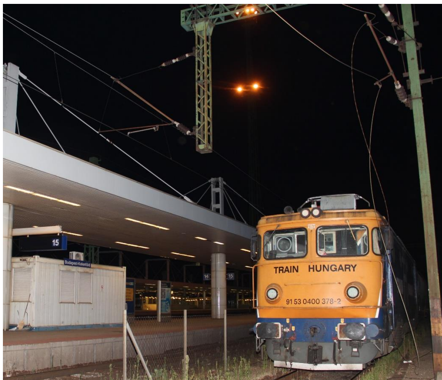
2. kép: Rongálódásos vasúti baleset Budapest-Kelenföld állomáson 2024.07.29.