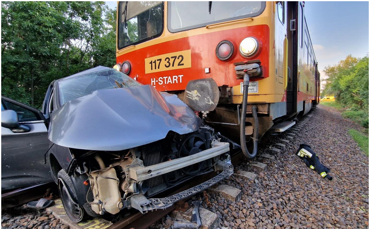
3. kép: Vasúti útátjáróban bekövetkezett baleset Csongrád és Szentés állomások között 2024.07.24.