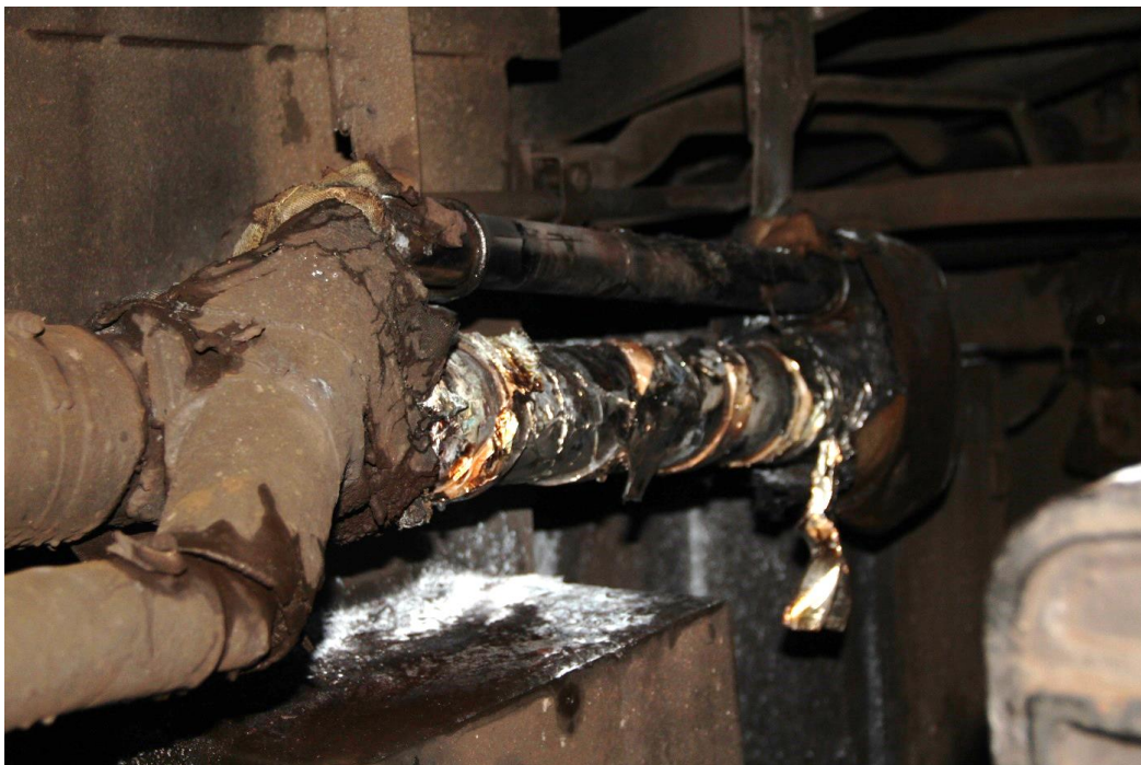
1. kép: Közlekedő vonat vasúti járművében keletkezett tűz Budapest-Keleti pályaudvaron 2024.07.26.