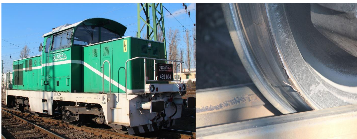
1. kép: Tolatás közben bekövetkezett baleset Ferencváros állomáson, 2024.01.30.