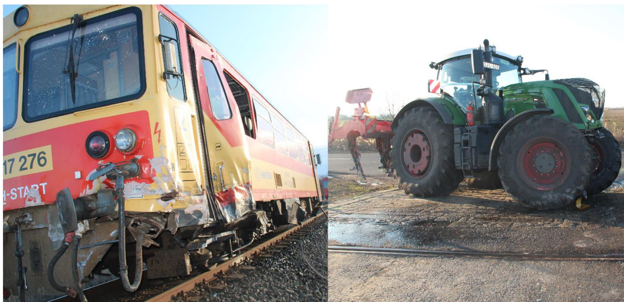
2. kép: Vasúti úttájróban bekövetkezett, a vonaton három utas könnyű sérülésével járó baleset Jászladány és Jászkisér állomások között, 2024.01.15.