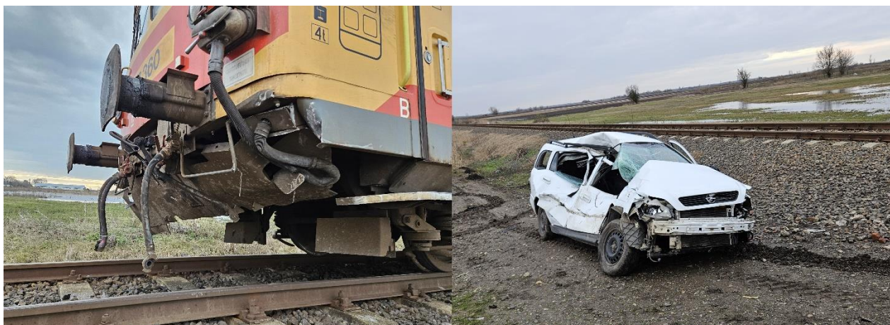
2. kép: Vasúti útátjáróban bekövetkezett, egy súlyos sérüléssel (személygépkocsi vezetője) járó baleset következményei Püspökladány és Biharnagybajom állomások között, 2023.12.15.