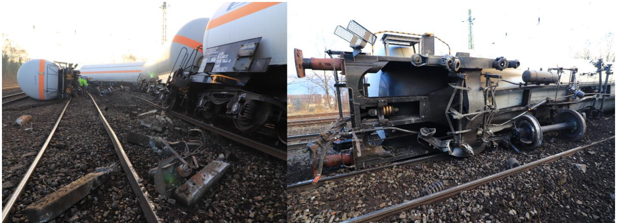
1. kép: Közlekedő vonat balesete Nagymaros állomáson 2023.12.30-án

forgóvázat keresztbe fordította, a 10-es váltót megnyitotta, a mögötte közlekedő kocsik egy része kisiklott, egy része a 2. vágányra haladt be, aminek következtében a vonat a 11-12. kocsik között szétszakadt és a 13. kocsitól 9 kocsi kisiklott. A kisiklott kocsik közül kettő az oldalára borult. Az esemény következtében a K2 jelű kijárat jelző és a vágányhálózat súlyosan rongálódott, valamint az 501. szelvénytől az elrepülő GEO csavarok épületeket, és parkoló autókat rongáltak meg. Személyi sérülés nem történt.