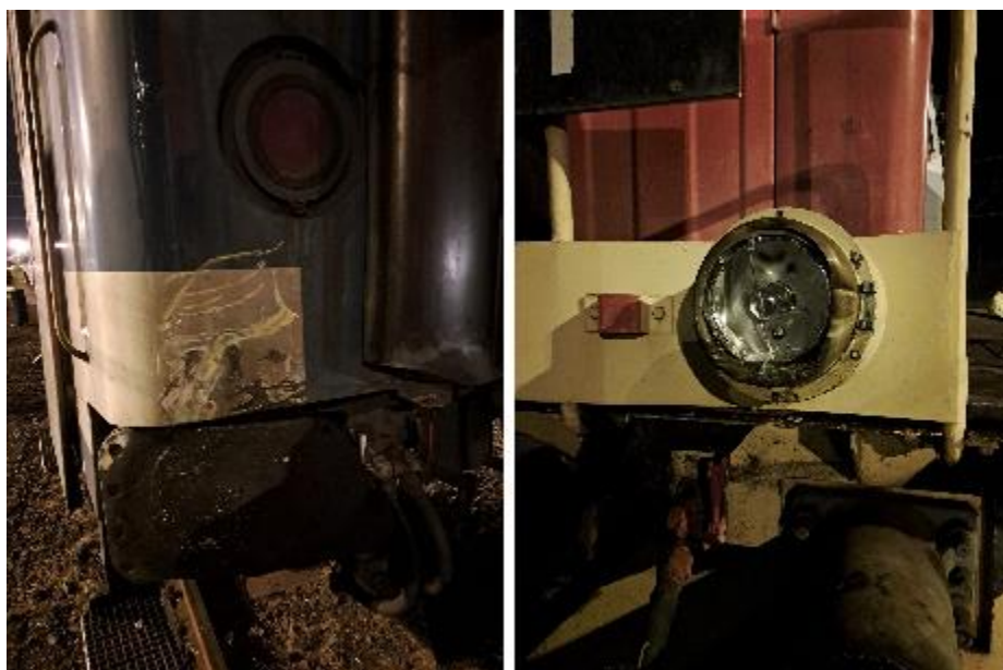
2. kép: Elegyrendezés közben bekövetkezett baleset következményei Miskolc-Tiszai állomáson 2023. november 9-én