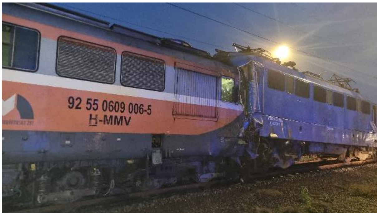
1. kép: Közlekedő vonat balesete Sáp állomáson 2023. november 15-én