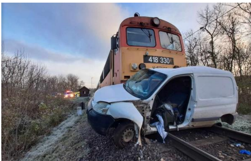
3. kép: Vasúti útátjáróban bekövetkezett, két súlyos sérüléssel (személygépkocsi vezetője és utasa) járó baleset Veszprémvársány és Bakonyszentlászló állomások között, 2023. november 23.

A tárgy hónapban hét esemény történt, az előző hónapok alacsony esetszámához képest emelkedés mutatkozik. Öt esetben személygépjármű, egy esetben kisteherautó járművezetője, egy esetben pedig gyalogos szegte meg a KRESZ előírásait (három nem biztosított, két fény sorompóval illetve két fény- és félsorompóval biztosított vasúti átjáróban). A balesetekben egy esetben a gépjármű vezetője és utasa, egy esetben a labirintkorlátos gyalogos átjáróban közlekedő gyalogos halálos, illetve egy esetben a gépjármű vezetője és utasa szenvedett súlyos sérüléseket. A balesetek hat esetben anyagi kárral jártak és minden esemény jelentős vonatkéséseket okozott.