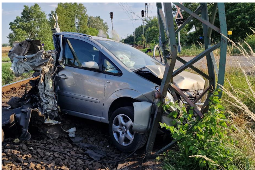
3. kép: Galambos-Kiskunfélegyháza között vasúti útátjáróban bekövetkezett baleset