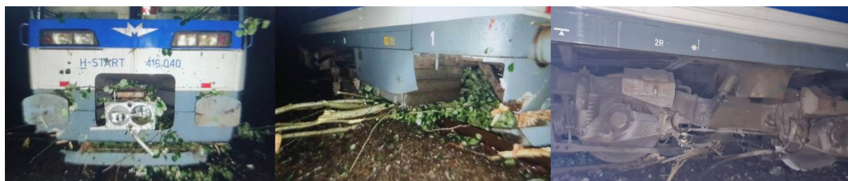
2. kép: Táborfalva és Lajosmizse állomások között, vonat ütközése úrszelvényben lévő akadállyal (következmény: rongálódás, siklás)

Három esemény során a felsővezeték hálózat is megrongálódott. Több esetben a vasúti pályát a helyreállításig kizárták a forgalomból és ez vonatkéseket eredményezett. Személyi sérülés nem történt.