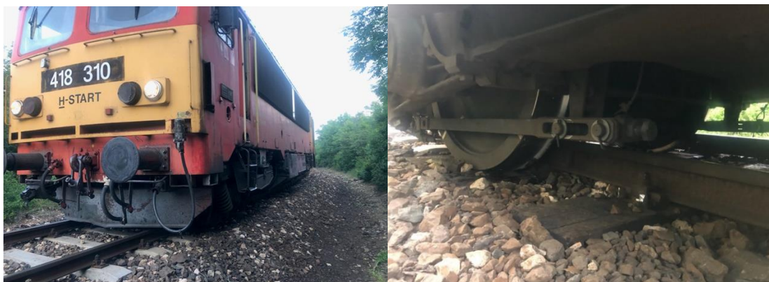
1. kép: Eplény-Veszprém között, közlekedő vonat balesete

I.T. Vonat járművében vagy rakományában keletkezett tűz vagy robbanás: nem történt.