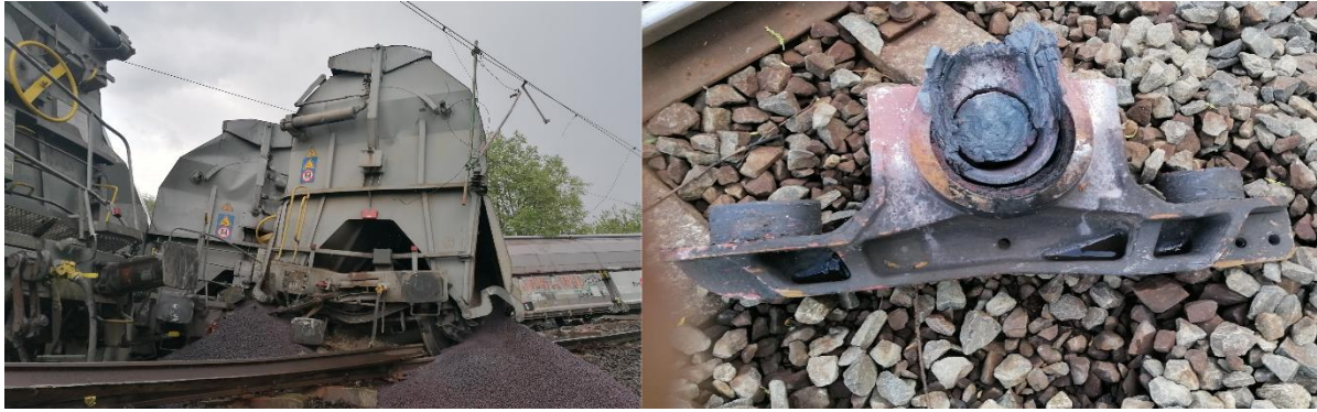
1. kép: Újfehértó-Hajdúhadház, közlekedő vonat balesete