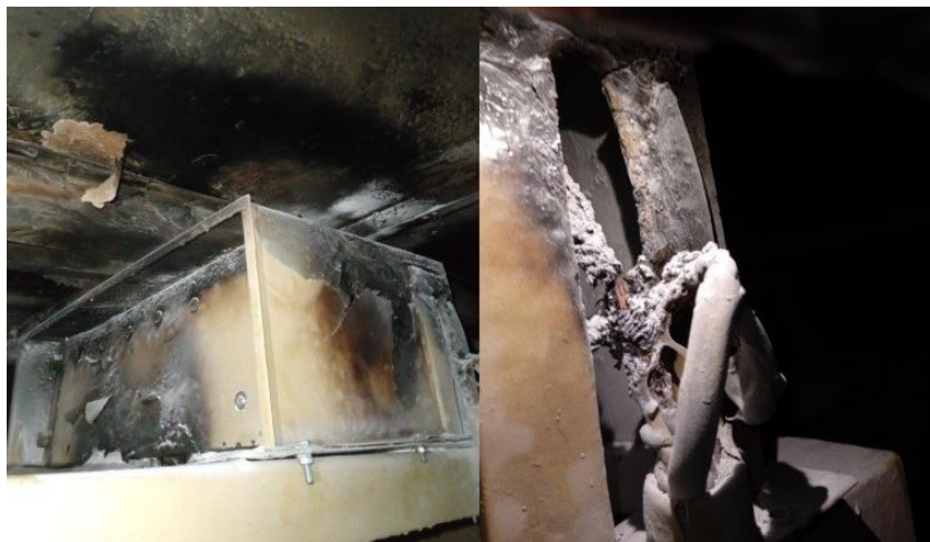
2. kép: Városlőd-Kislőd mozdony tűz