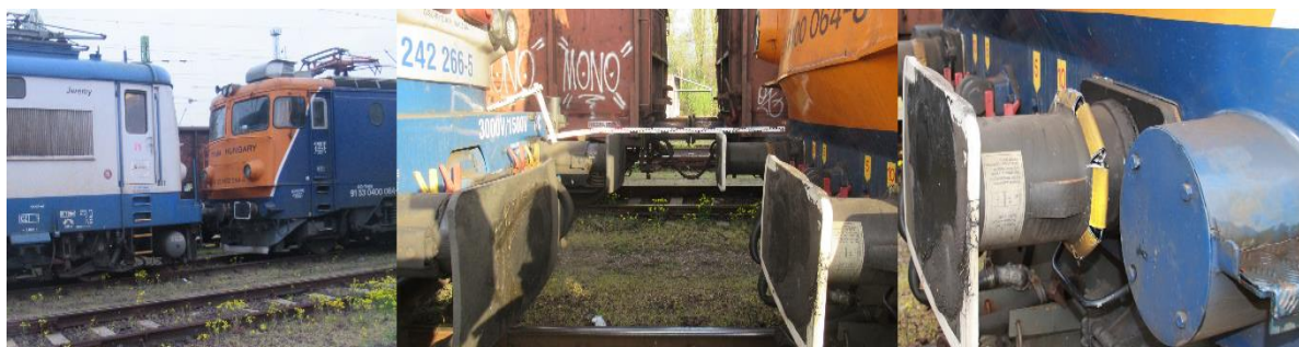
1. kép: Rákosrendező közlekedő vonat balesete